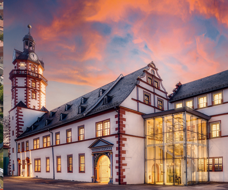
Me.Fotografie (M. Erbe)